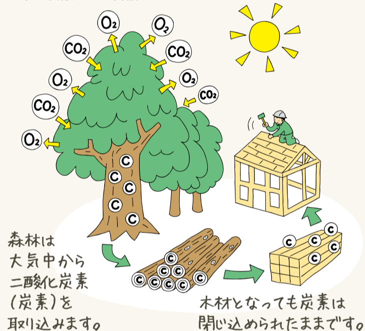
■木は炭酸ガスの缶詰